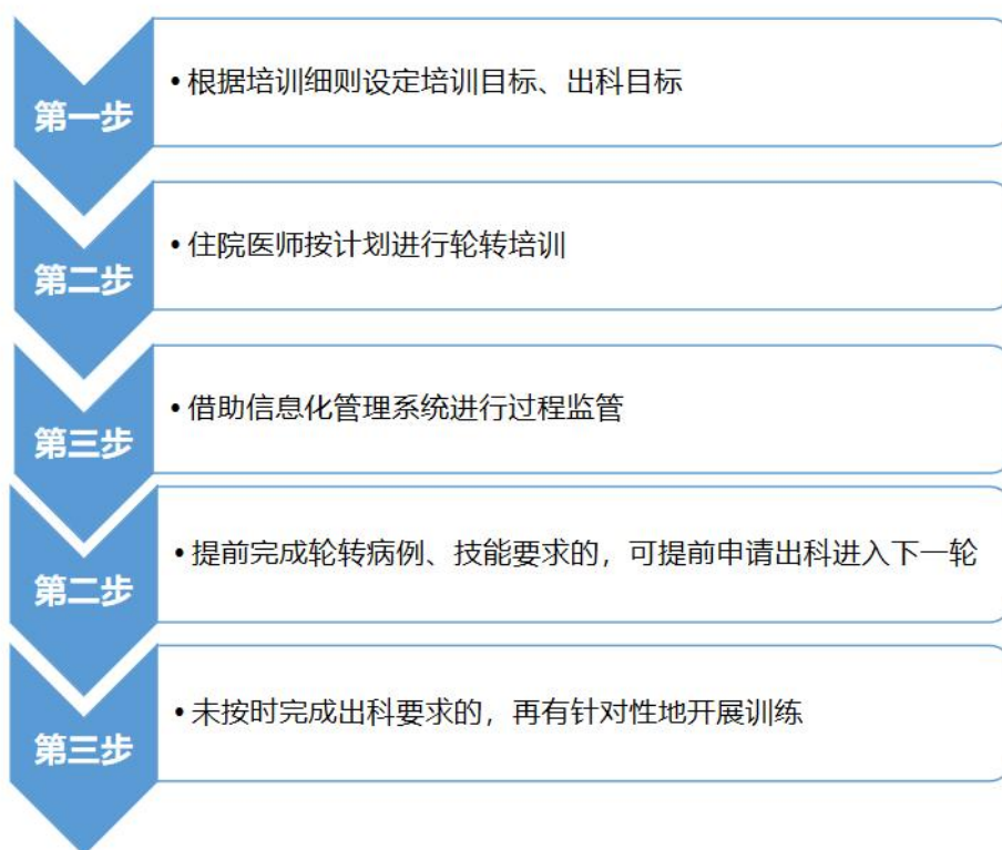
图2：以病例为核心的轮转培养模式

推行以岗位胜任力为目标的全真考核模式，全面提高学生临床实践与科学研究能力（见图3）。